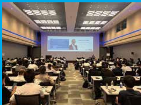
昨年 - 満員御礼!