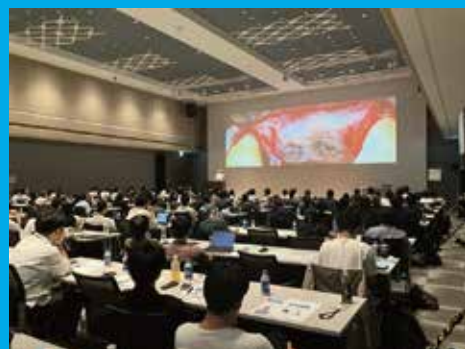
熱気あふれる会場