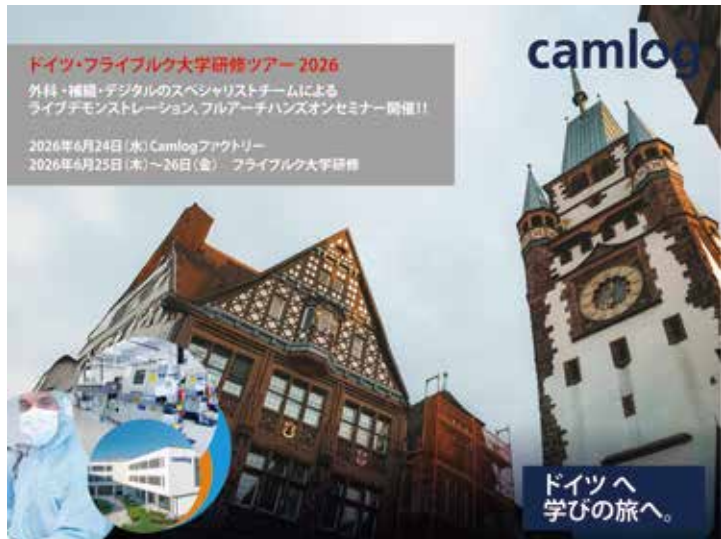
ドイツ・フライブルク大学研修 & Camlogファクトリー見学