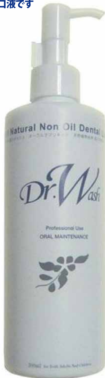
Dr.ウォッシュ 330mL (実寸大)