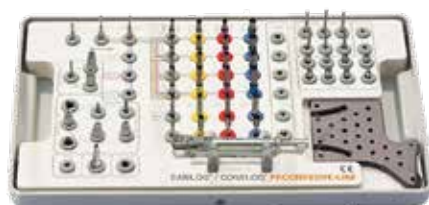
外科セット CAMLOG/CONELOG プログレッシブライン

・ガイド外科ベーシックセット プログレッシブライン 標準価格: ¥ 488,900 商品コード: J5300.0074 ・プログレッシブラインガイドシステム フルプラン 商品一覧 (右ページ)