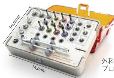
外科セット フレックス プログレッシブライン