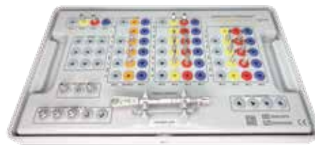
ガイド外科ベーシックセット プログレッシブライン