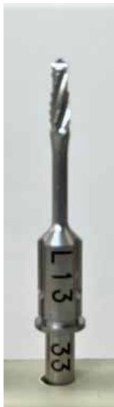
φ3.3 L13mm 用

骨頂傾斜部や抜歯窩の傾斜した内壁により、精密な起始点の形成に適した先端の尖ったドリルです。CA用で、硬い骨質にも使用できます。