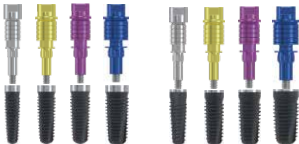
カムログスクリューインプラント プロモート (スクリューマウント) 標準価格 29,000円 (税別)