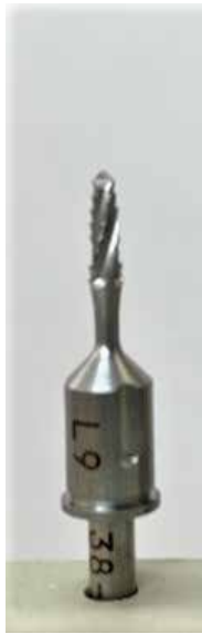
φ3.8/4.3 L9mm 用