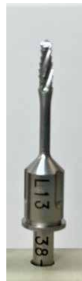
φ3.8/4.3 L13mm 用