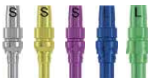
φ3.3 φ3.8 φ4.3 φ5.0 φ6.0