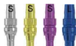
φ3.3 φ3.8 φ4.3 φ5.0