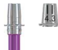
チタンベースアバットメント Dタイプ クラウン/ブリッジ