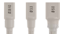
φ3.3 φ3.8/φ4.3 φ5.0