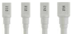
φ3.3 φ3.8 φ4.3 φ5.0/6.0