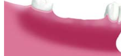
複数歯の欠損例(欠損空隙)。