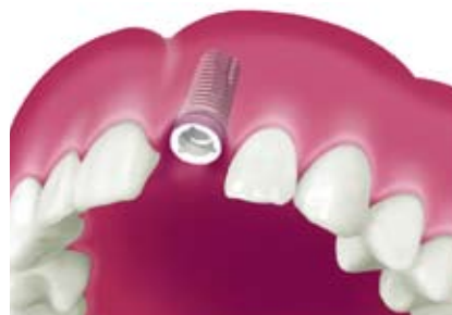
インプラントが骨の中で治癒した状態。