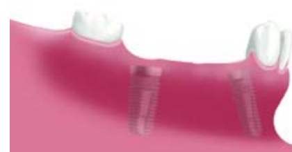
2本のインプラントがあごの骨の中で治癒した状態。