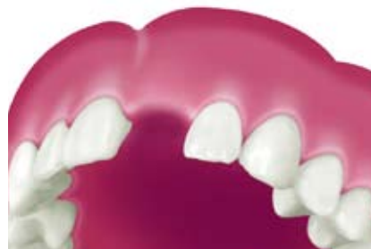
歯が一本欠損した状態。