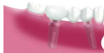
インプラント2本でサポートされた3ユニットブリッジ。