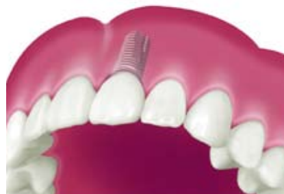
クラウン(歯冠)で修復された状態。