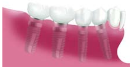
4本のインプラントを用いた1歯ごとの修復例。