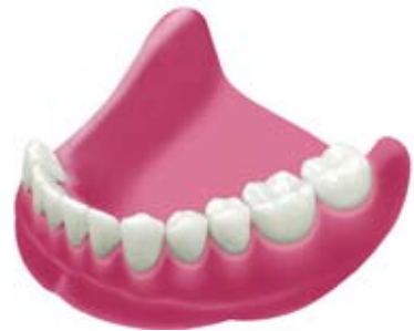
『遊離端欠損』の例です。インプラントの数は空隙の大きさやあごの状態、加えられる負荷によって変わってきます。

同じ側の歯列で奥の歯から数本欠損している状態を『遊離端欠損』と呼び、この場合、固定性の修復にはインプラントが最良かつ唯一の選択です。インプラント以外の方法としては部分入れ歯しかないでしょう。部分入れ歯ではクラスプと呼ばれる鈎状の維持部を隣の歯に架けるため、審美性や装着感が悪く、また、長期的には支台となる歯を傷めることにもなります。